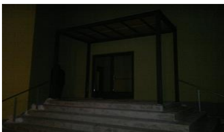
Väljapääs B Korpuse uksest