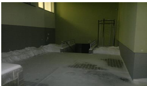
Väljapääs Raamatukogu tagaruumist