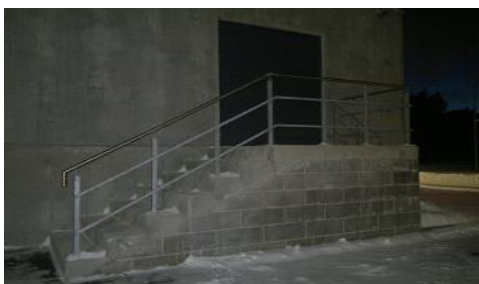
Väljapääs suurest saalist