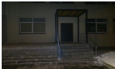
Väljapääs B-korpuse söökla taga uksest