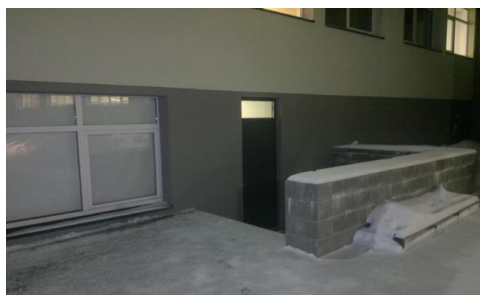
Väljapääs A korpuse keldrist