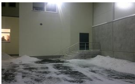
Väljapääs suurest saalist sisehoovi