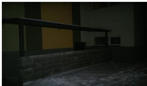
Välja pääs A-korpuse otsast